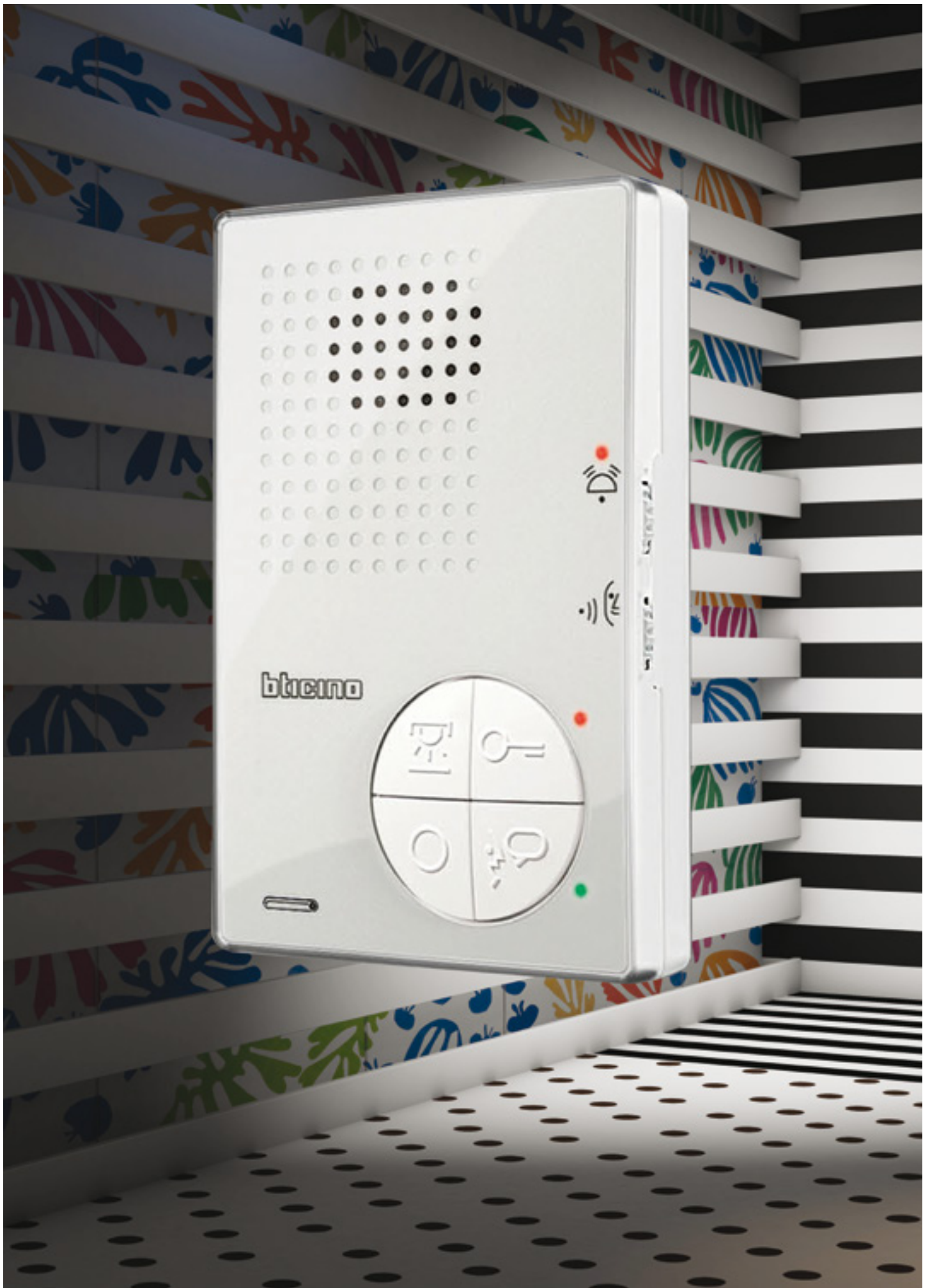
Deurtelefoon T-40 Bergen